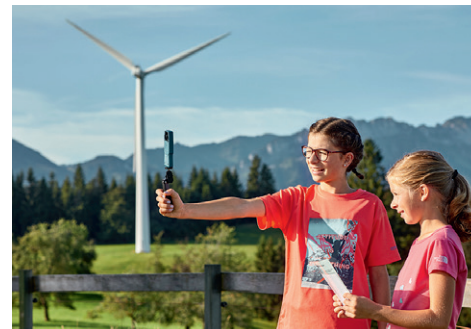
Wissenswertes rund um die Windenergie erfahren die Lernenden auf dem Themenweg Erlebnis Energie Entlebuch