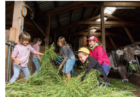
Naturpark Beverin: Wie viel Futter braucht eine Milchkuh?

«Von wo kommen unsere Nahrungsmittel und wie werden sie hergestellt? Wie erreichen sie unseren Teller und was bedeutet das für die Umwelt, Wirtschaft & Gesellschaft?» Erleben Sie das hautnah vor Ort. Im Naturpark Beverin z. B. am Beispiel des Kreislaufes von der Kuh zum Käse, oder vom Getreide zum Brot im Val Müstair!